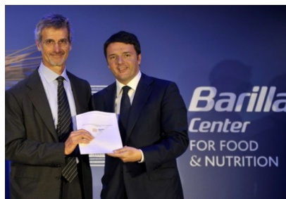
Il Governo aderisce al Protocollo di Milano

Si impegna ad analizzare i grandi temi legati all'alimentazione e alla nutrizione nel mondo.