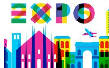
FEEDING THE PLANET ENERGY FOR LIFE